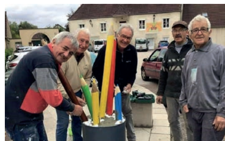
Installation avant l'obligation du port du masque