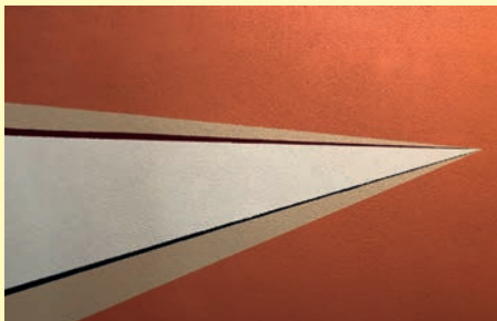
Détails de rénovation

Il aura en charge les bâtiments communautaires et l'accessibilité.